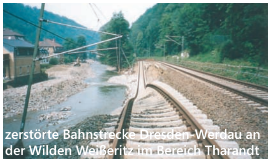
zerstörte Bahnstrecke Dresden-Werdau an der Wilden Weißeritz im Bereich Tharandt