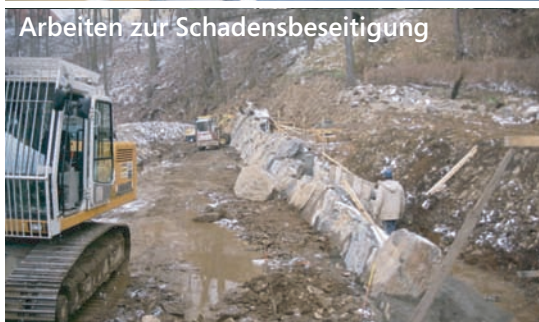
Arbeiten zur Schadensbeseitigung