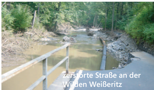
zerstörte Straße an der Wilden Weißeritz