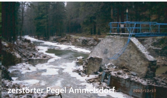
zerstörter Pegel Ammelsdorf