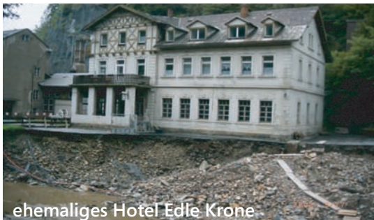
ehemaliges Hotel Edle Krone